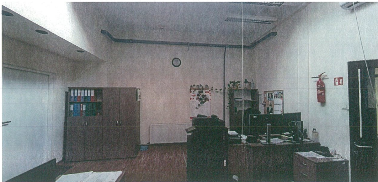
Zdjęcie nr 2 – widok pomieszczenia mistrza napraw bieżących w Oddziale Przewozów R1 „Woronicza”.

Miejskie Zakłady Autobusowe Sp. z o.o., 01-710 Warszawa, ul. Włociańska 52