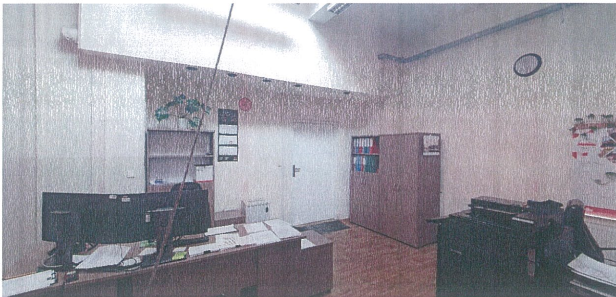
Zdjęcie nr 3 – widok pomieszczenia mistrza napraw bieżących w Oddziale Przewozów R1.

Wydział Infrastruktury i Inwestycji Inspektor